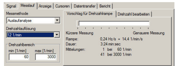
Messplanung, optimale Parameter für Drehzahländerung