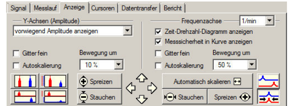
Kurven praktisch sortieren, zoomen, stauchen oder auch in der Frequenzachse verschieben und alle Ordnungen untereinander darstellen.