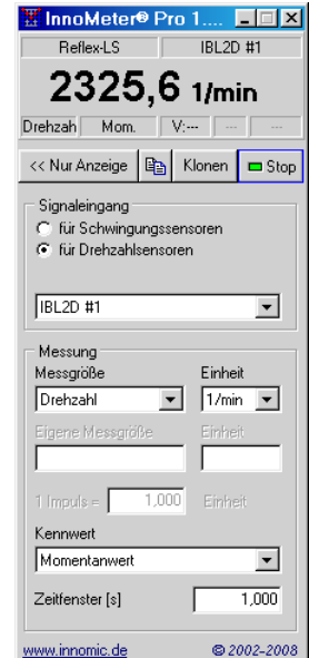
InnoMeter Pro - Drehzahlsensoren